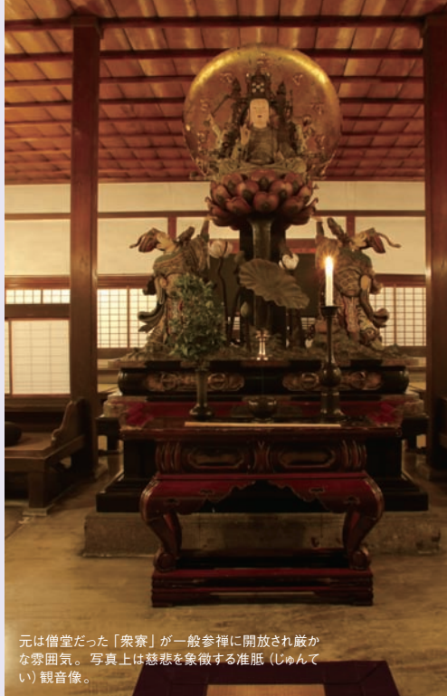
元は僧堂だった「衆寮」が一般参禅に開放され厳かな雰囲気。写真上は慈悲を象徴する准胝（じゅんてい）観音像。