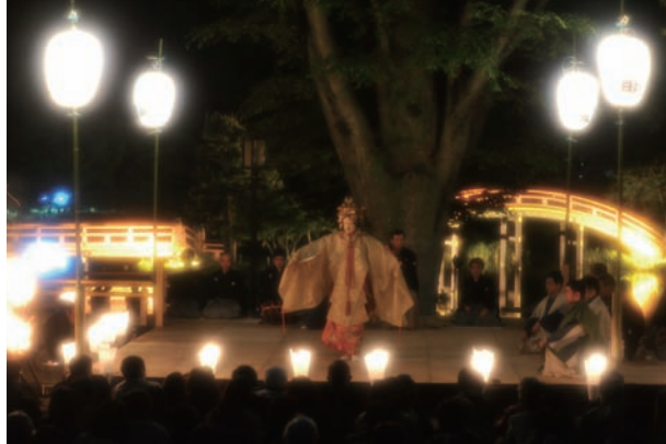
今年演じられる「金沢狸々」(右)と、平成23年の第14回「称名寺薪能」で演じられた「羽衣」の一場面(左上)。