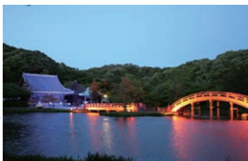
薪能当日は庭園もライトアップされる。

美しい称名寺の浄土式庭園。称名寺境内には県立金沢文庫があり、所蔵品を展示している。